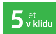
Předplacený servis na 5 let / 100 000 km při financování od ŠKODA Finance