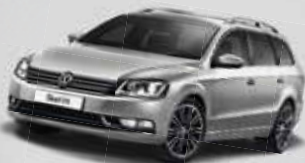
PASSAT VARIANT COMFORTLINE 2.0 TDI BMT 103 kW