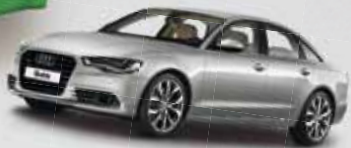
A6 EDITION 2.0 TFSI 132 kW