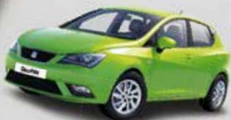
IBIZA REFERENCE 1.2 44 kW

Vyberte si z chutné nabídky vozů za zaručeně nejlepších podmínek – i výhodněji než za hotové. Kompletní menu najdete u autorizovaných prodejců Volkswagen, Audi, SEAT a ŠKODA.