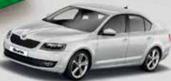
OCTAVIA AMBITION 1.2 TSI 77 kW